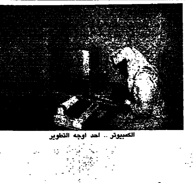
الكيبورت .. احد اوجه التطوير